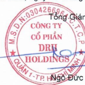
Ngô Đức Sơn